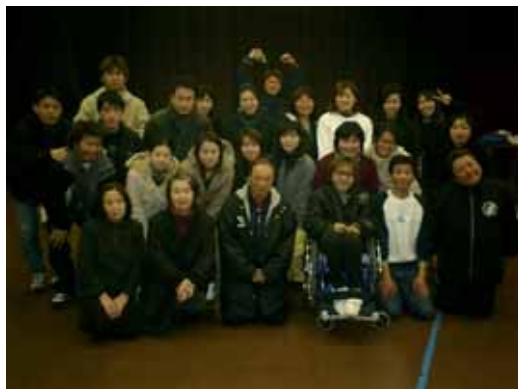
全受講生の集合写真

最終日は、午前8:30より視覚障害者の移動介助の基礎知識について学んだ後、受講生が代わる代わるアイマスクを付けて町中を歩いたり、電車やバスへの乗車体験、デパートでのエスカレーターの乗降や買い物等の屋内外実習を行ないました。