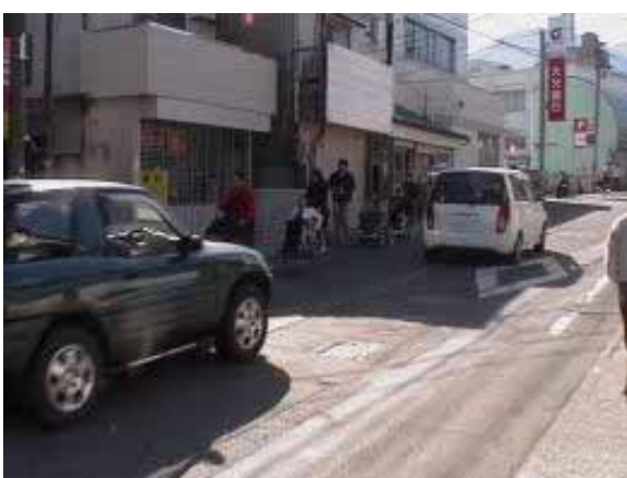
べっぶだいがくいりぐち しゅうごう 別府大学入口に集合し、いよいよ出発

ゴール地点の上人ヶ浜公園に向け進んで行くと最初の難関、大学通りにぶつかりました。大学通りは片側一車線しかなく、その割に交通量(バス等、大型車両)が多い。又、歩道、車道共に舗装が悪く狭い上に凹凸した箇所が多い為、車椅子で通行するには、車道側を通らなければいけない場合も多いので、いつ事故が起きてもおかしくありません。