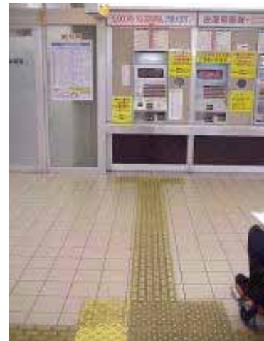
べっぶえききっぷはんばいき J R 別府駅切符販売機